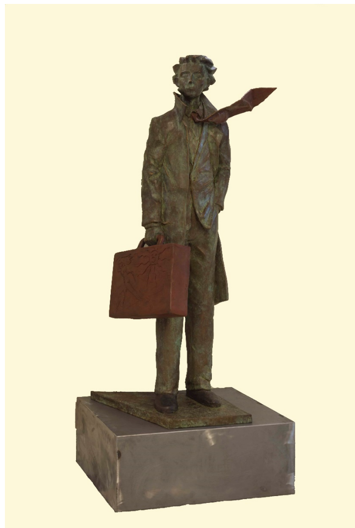
Partenza Giampaolo Talani, 2017., bronzo policromo, 160 cm Collezione della Banca